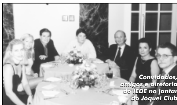
Convidados, amigos e diretoria do IEDE no jantar do Jôquei Club