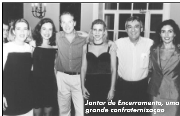
Jantar de Encerramento, uma grande confraternização