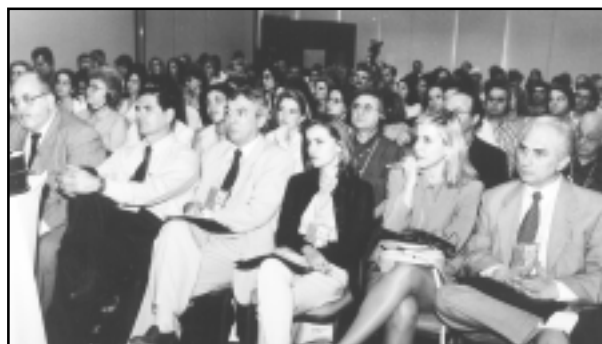
Auditório lotado em todas as conferências.

ativa e a liberdade. Enfim vamos lutar para que a medicina no nosso estado volte a ser a excelência que era.